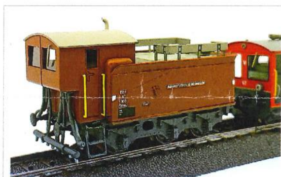
EBT X 3 1303

SBB-CFF X 3 92714 oder EBT X 3 1303 Unkrautsprühwagen , aufgebaut auf ex 3 Achs Tender von SBB B 3/4. Vorbild ist nicht selbstfahrend, wurde jeweils geschoben. Es wurden verschiedene Tender-Varianten eingesetzt, auch Sprühwagen ohne Kabine. Der EBT X 3 1303 wurde in den 70er Jahren auch auf den Stecken der BLS eingesetzt.