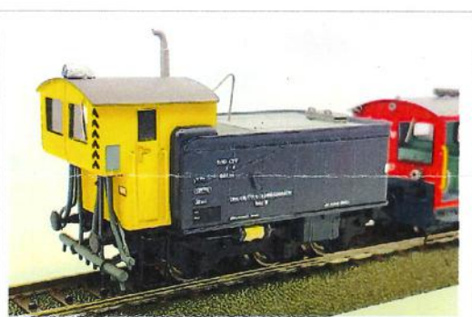
SBB-CFF X 3 92714